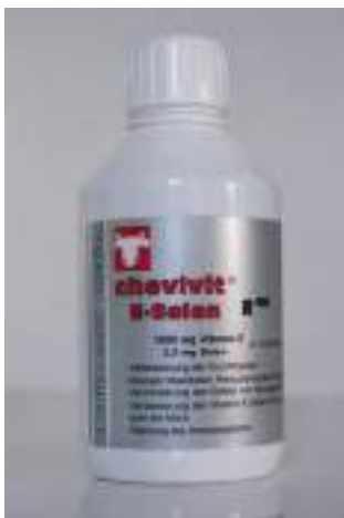
Abb. 4: Chevivit E-Selen® biotaugliches Ergänzungsfuttermittel – enthält Vitamin E und Selen

Futtermittel sind eindeutig auf der Verpackung und/oder auf dem Sackanhänger als solche gekennzeichnet, auch jene, die von Tierärzten abgegeben werden (z. B. Ergänzungsfuttermittel, Diätfuttermittel).