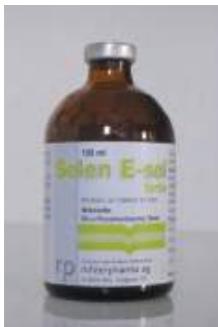
Abb. 5: Selen E-sol®-Arzneimittel – enthält Vitamin E und Selen

Das Injektionspräparat Selen E-Sol® (rechts, Abb. 5) ist ein Arzneimittel, während das über das Maul zu verabreichende Präparat Chevivit E-Selen® (links, Abb. 4)