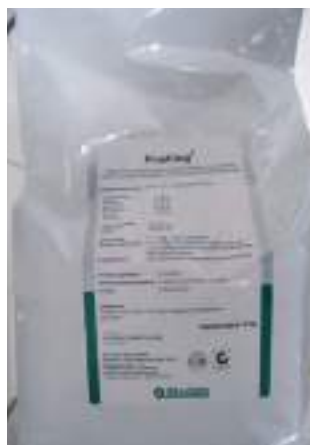
Abb. 6: Flushing – Ergänzungsfuttermittel

zwar ebenfalls Vitamin E und Selen als Wirksubstanzen enthält, aber als biotaugliches Futtermittel eingestuft ist.