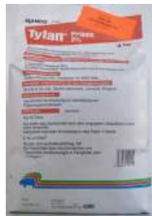
Abb. 7: Tylan – Arzneimittel mit Antibiotika

Tylan ist ein Arzneimittel, Flushing ist ein nicht biotaugliches Ergänzungsfuttermittel.